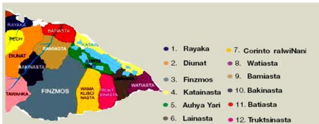
Figura 3. Consejos Territoriales del pueblos Miskitu

Cada Consejo Territorial cuenta con un consejo directivo. Adicionalmente el consejo de ancianos completa la estructura política de MASTA y es un ente importante especialmente en la resolución de conflictos y orientación espiritual.