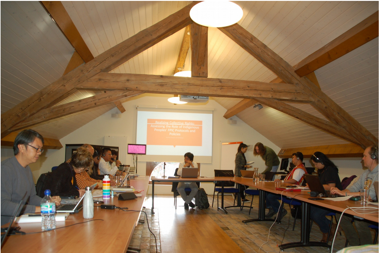
Genfer Dialogtreffen zu FPIC-Protokollen, 24. November 2018

ihrem Kontext analysiert sind. Diese Datenbank befindet sich noch in einem Versuchsstadium und ist noch nicht öffentlich zugänglich. Außerdem wurden VertreterInnen indigener Völker aus Peru, Malaysia, Brasilien, den Philippinen, Kolumbien und einigen anderen Ländern zu einem Austausch im Vorfeld des UN-Forums für Wirtschaft und Menschenrechte im November nach Genf eingeladen, um über ihre Erfahrungen, Empfehlungen und Wünsche vorzustellen und zu diskutieren.